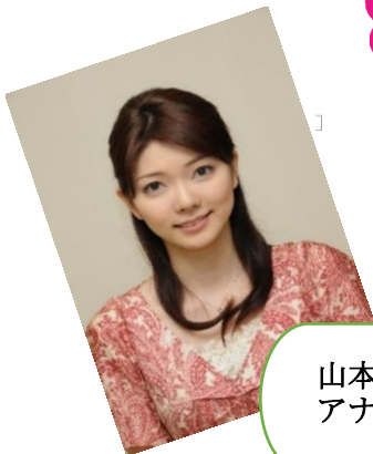
山本 悠美子 アナウンサー